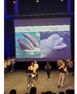
© Frédéric Fasquel et Caroline Landreau

Lors de cette journée, les 15 classes ont aussi pu visiter l'aquarium de manière autonome et ont assisté au spectacle « C/O » de Jörg Müller-Noustube qui les a fait beaucoup réagir.